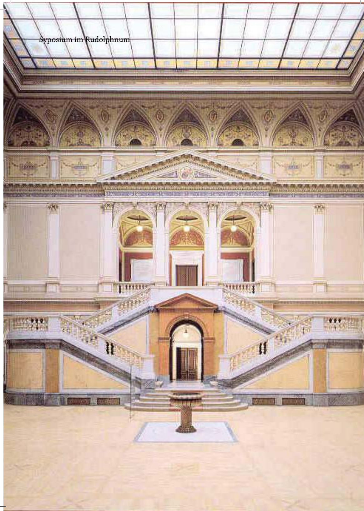
Syposium im Rudolphnum